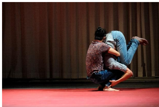
study for PANORAMA, Giulio D'Anna