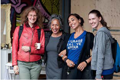
Vrijwilligers bij de locatievoorstelling COURAGE