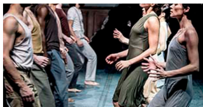
BROOS [2019] – foto's Andreas Terlaak

Na de grote zaalvoorstellingen HOME, BROOS en KIEM die allen vanuit een sterk persoonlijke urgentie gemaakt zijn, wil Conny Janssen vanaf 2021 met haar nieuwe creaties voor de grote zaal de focus richten op beeld, beeldvorming en identiteit.