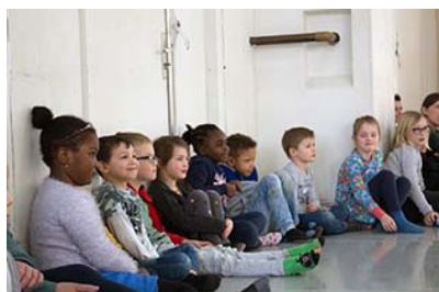
Openbare repetitie in de studio

Door de ruimte die het nieuwe Huis biedt gaat bovendien een langgekoesterde wens in vervulling om structurele samenwerking op te zetten met het onderwijs, met MBO-(kunst)opleidingen in Rotterdam en in de directe omgeving met middelbare- en basisscholen in Rotterdam Zuid en op Katendrecht.