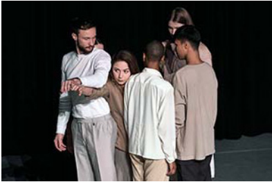
Uitwisseling met Kannon Dance (Rusland)