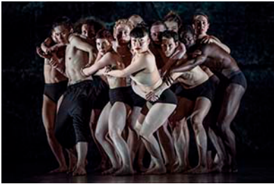
INSIDE OUT [2018]

Ik besef steeds meer hoe bijzonder het is dat ons ensemble niet alleen bestaat uit kwalitatief goede dansers, maar dat zij een afspiegeling vormen van de grootstedelijke samenleving. Die diversiteit ervaar ik als een enorme rijkdom. Ik bouw aan een team van ervaren dansers, die garant staan voor verdieping en duurzaamheid. Met ons talent-programma hebben we een optimale structuur gevonden waardoor steeds nieuw bloed binnenstroomt, terwijl de basis-kwaliteit hoog blijft. Met de mogelijkheden binnen ons nieuwe Huis kunnen we alle verhalen vertellen die we willen.