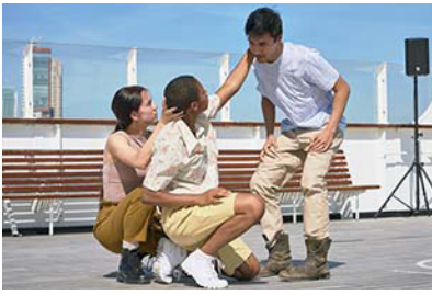
FRATELLO|SORELLA [2019] Davide Bellotta SS Rotterdam

Hoe mooi zou het zijn dat ieder mens, waar je ook woont en wat je ook te besteden hebt, met kunst en cultuur in aanraking kan komen. Om een wereld van verbeelding te ontdekken die ontroert, verwondert, je aan het denken zet. Ontmoetingen die je nieuwsgierig maken naar het onbekende en je helpen te ontdekken wie je bent. Die de horizon verder leggen dan dat wat al in je systeem zit. Die in de samenleving waar zoveel verschil is, ook een gevoel oproepen dat je erbij hoort. Dat het ook over jou gaat. En die de soms scherpe randen ook zachte kanten geven. In ons Huis willen wij ruimte geven aan die ontmoetingen door ons werk te delen, jonge makers kansen te geven en door interactie met onze omgeving.