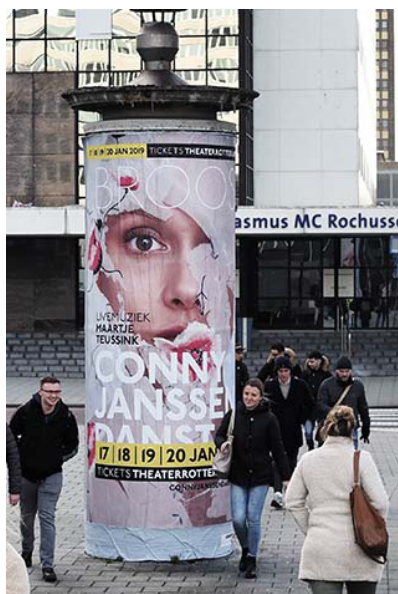
Publiciteit in de openbare ruimte

De databases zijn een waardevol middel om met publieksgroepen in contact te komen. Zo kunnen per e-mail 6.000 relaties bereikt worden en bestaat het netwerk via sociale media als Facebook, Twitter en Instagram uit bijna 20.000 volgers. De verscherpte AVG-regels waren in 2018 aanleiding voor herinrichting van de databases, wat resulteerde in gerichtere communicatie met publiek.