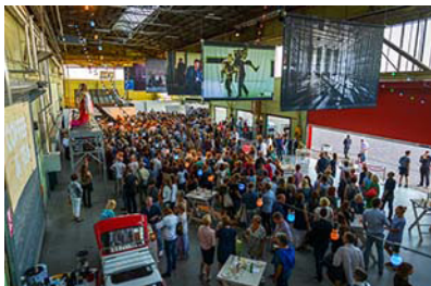
MIRROR MIRROR [2017] De Onderzeebootloods

als in elektronische muziek thuis is. Startpunt zijn klassieke thema's die geïnterpreteerd kunnen worden en als inspiratie dienen voor het ontwikkelen van nieuwe eigen composities.