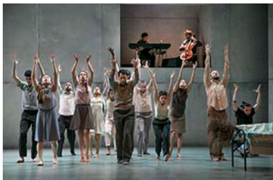
HOME [2017]

En natuurlijk was daar eind 2019 de langverwachte verhuizing naar Katendrecht, waarmee de transitie van gezelschap naar Huis is ingezet en er gewerkt kan worden aan de ambities op het gebied van talentontwikkeling, educatie, onderzoek, samenwerking en presentatie.