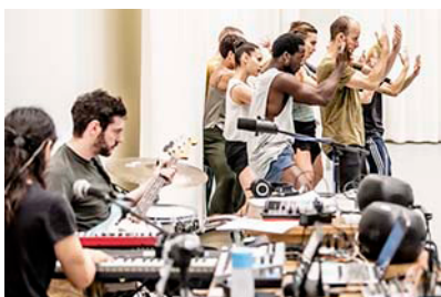
KIEM [2019]

Deze intensieve trajecten helpen om de afstand tussen vakopleidingen en het professionele werkveld te verkleinen. Bovendien zorgen de stageplaatsen ervoor dat jonge dansers al tijdens hun studie gezien worden. Voor ons ensemble is het belangrijk dat er jonge aanwas blijft komen, terwijl het technische niveau op peil blijft. Dat borgen we met dit programma.