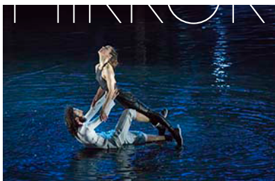
MIRROR MIRROR [2017]

In de periode 1 januari 2017 - 1 maart 2020 trok Conny Janssen Danst met in totaal 17 producties en 386 voorstellingen ruim 130.000 bezoekers. Hiervan waren 107 speelbeurten in Rotterdam met bijna 47.000 bezoekers. De belangrijkste producties waren de grote zaalvoorstellingen HOME, INSIDE OUT, BROOS en KIEM, de locatievoorstelling MIRROR MIRROR, de overzichtstentoonstelling in de Kunsthal, de festivalvoorstelling CLARITY en de jaarlijkse edities van DANSLOKAAL.