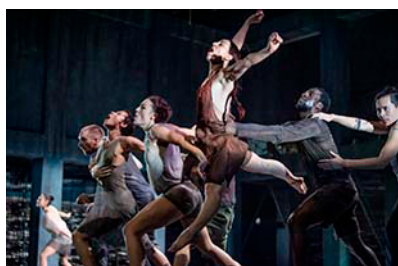
KIEM [2019]