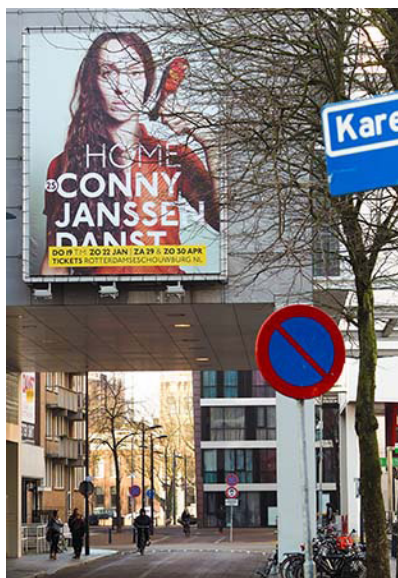
Theater Rotterdam

Conny Janssen Danst is een begrip in Rotterdam en een visitekaartje voor de stad. Met een geboren en getogen Rotterdamse artistiek leider, die zich voor haar werk laat voeden door haar eigen stad, maakt Rotterdam onlosmakelijk deel uit van het DNA van het gezelschap: van de havens tot Theater Rotterdam.